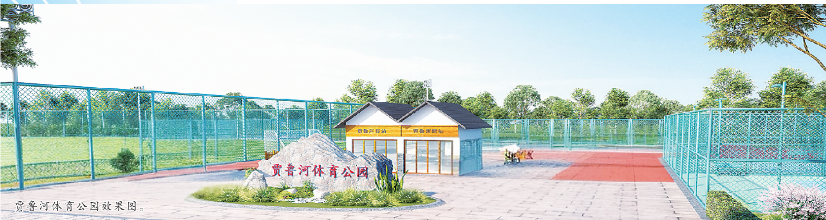
贾鲁河体育公园效果图。