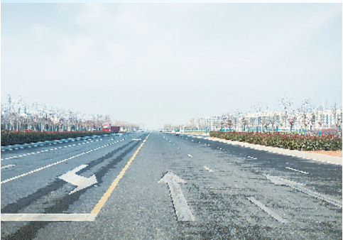
打通“断头路”,畅通“微循环”。

一件件民生实事的落地,化作温暖人心的生活图景;一个个民生工程的投用,见证品质川汇的建设步伐,不断增强全区人民群众的获得感、幸福感、安全感。