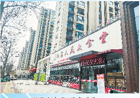
社区大食堂,服务暖民心。