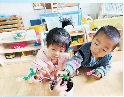
托幼一体化,破解“带娃难”。