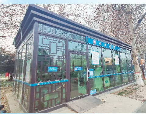
道德书屋成全民阅读新空间。