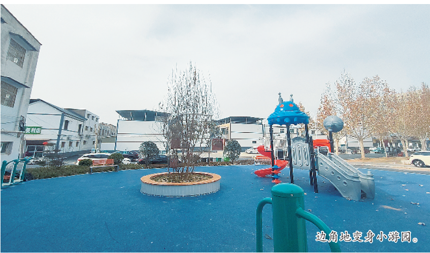
边角地变身小游园。